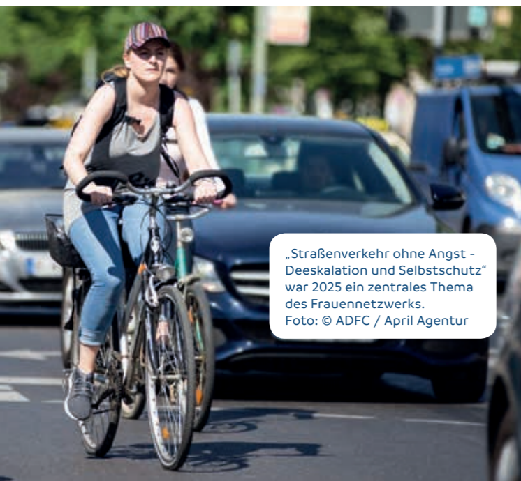
„Straßenverkehr ohne Angst - Deeskalation und Selbstschutz“ war 2025 ein zentrales Thema des Frauennetzwerks.

Per Newsletter erfahren Frauen, was sich im Netzwerk tut. Interessierte Frauen können diesen per E-Mail an „ frauen@adfc-hessen.de “ abonnieren. Auch auf der Homepage des ADFC Hessen finden sich immer wieder Beiträge des Frauennetzwerks. Denn die Netzwerkfrauen sind überzeugt: Mehr Frauen im ADFC erreichen wir nur mit sehr guter Kommunikation und mehr Sichtbarkeit. Daran werden sie auch 2026 arbeiten.