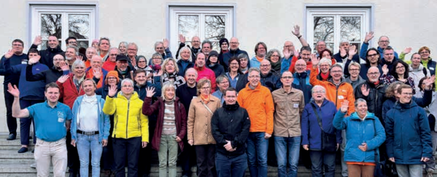
Die Teilnehmenden des HessenForums 2025 in Kassel.