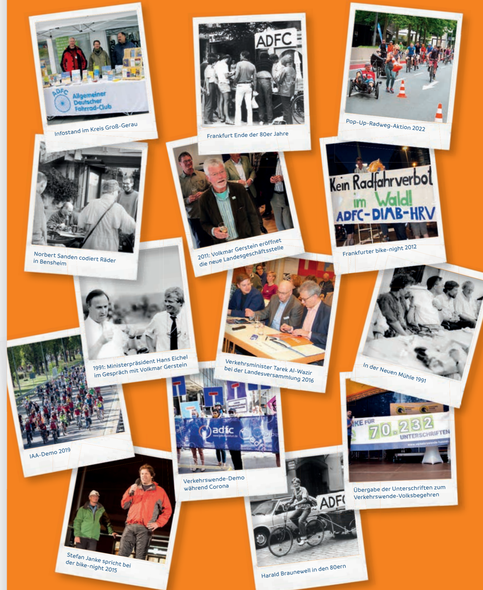
Infostand im Kreis Groß-Gerau