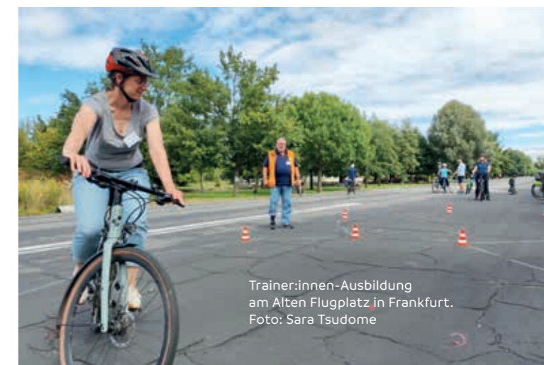
Trainer:innen-Ausbildung am Alten Flugplatz in Frankfurt.

Mit dem Abschluss dieser ersten Ausbildungsrunde legt der ADFC den Grundstein für eine flächendeckendere Förderung der Radkompetenz in der Region. Der Landesverband setzt die Ausbildung von Radspaß-Trainer:innen auch 2026 fort. Wer Interesse an einem „Radspaß“-Kurs hat, kann sich bei seiner lokalen ADFC-Gliederung informieren.