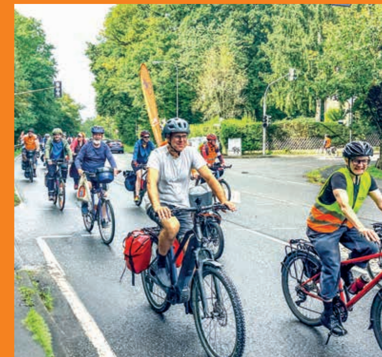
Die TaunusRadDemo passiert die Kronberger Waldsiedlung.

Mit einer Gesamtdistanz von 42 Kilometern durch den Taunus, hinauf zur Saalburg und wieder herab, dürfte im September 2025 eine der längsten Radfahrdemos des Jahres stattgefunden haben. Rund 150 Radfahrende demonstrierten trotz angekündigter Regenschauer gegen das lückenhafte Radnetz im Hochtaunuskreis und setzten so ein deutliches Signal an die Politik. Die Frankfurter ADFC bike-night bewegte sich zwar auf deutlich kürzerer Strecke als die Demo im Taunus, erreichte 2025 mit 3.500 Teilnehmenden aber eine Rekord-Mobilisierung. Ebenfalls im September fand die Kasseler Rad-Nacht statt.