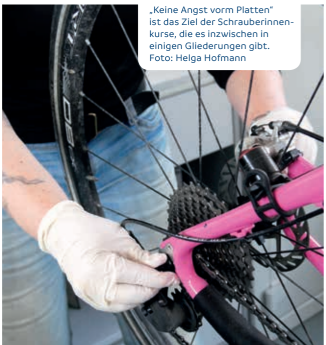
„Keine Angst vorm Platten“ ist das Ziel der Schrauberinnenkurse, die es inzwischen in einigen Gliederungen gibt.