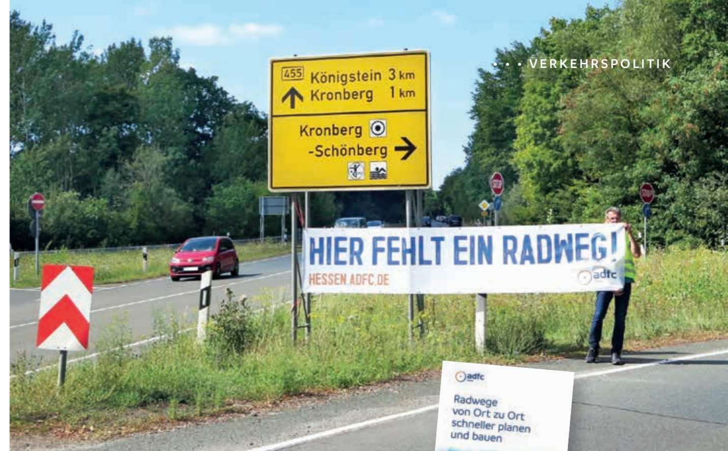
Wie hier zwischen Königstein und Oberursel fehlen überall in Hessen sichere überörtliche Radverbindungen.